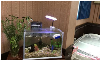
ローズマリーの香りで癒しも提供