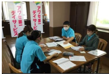
評価・モニタリングの研修