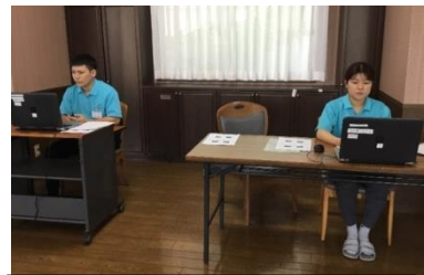
仕事のスキルアップ研修