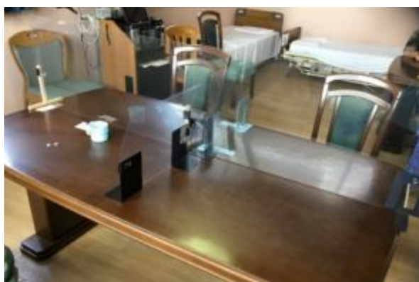
パーテーションも増やしました。