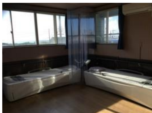
ウオーターベットにも 感染予防対策を行いました。