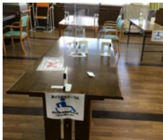
車イス専用のテーブルを作りました （移動がスムーズできるように）